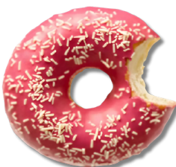
Gogoasă cu glazură cu aromă de căpșune