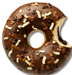
Gogoasă cu glazură și umplură de ciocolată