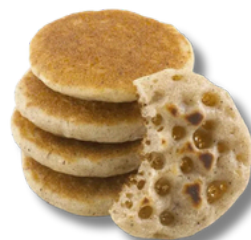
Miniclătite cu topping 8 buc