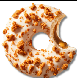
Gogoasă cu umplură de caramel și bucăți de biscuiți