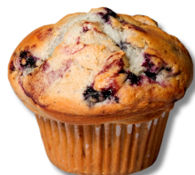
Brioșă cu iaurt, afine și coacăze