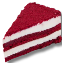
TORT RED VELVET