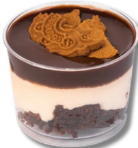
Cup Cookie pandișpan și biscuit