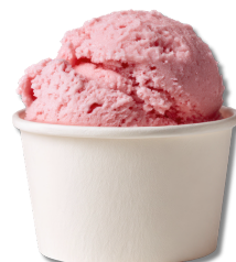
ÎNGHEȚĂȚĂ AROME 1 CUPĂ