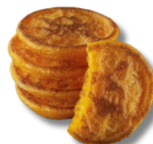
Miniclătite cu zahăr pudră 8 buc