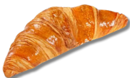
CROISSANT CU UNT

Pentru momentele când „doar ceva dulce” nu mai e negociabil.