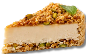
Cheesecake cu Baklava