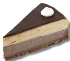
Mousse cu biscotto și ciocolată